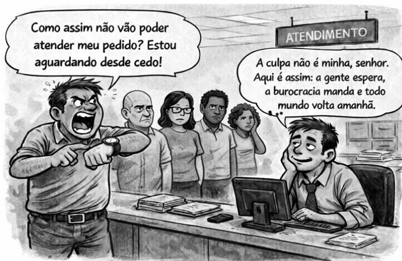
Figura: Imagem gerada por I.A.

Com base na cena, assinale a alternativa que representa a conduta correta para o servidor na situação descrita.